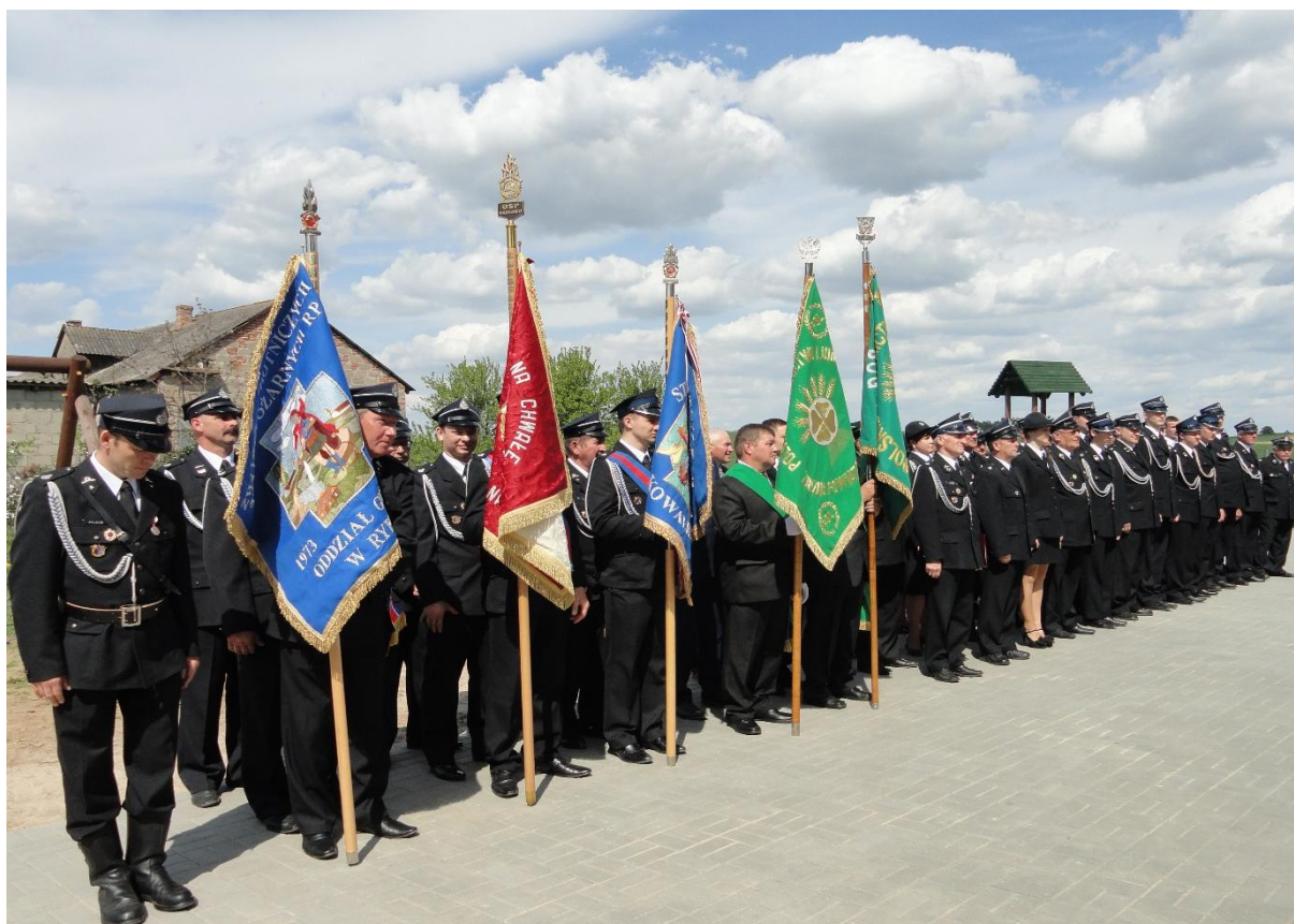
Zbiórka podczas uroczystości.