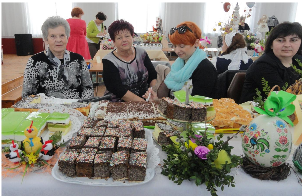
Stoisko KGW Rusinowo.