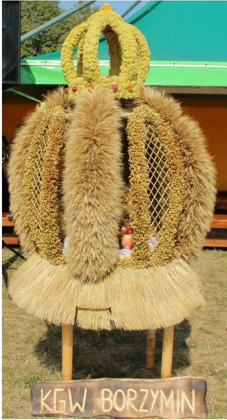
Wieniec KGW Borzymin.