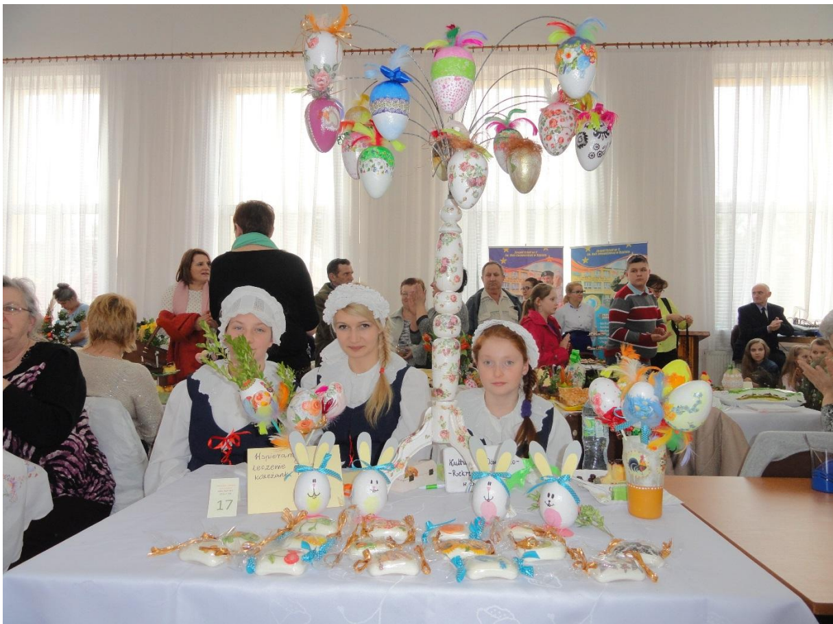
Stoisko Centrum K-O-R ze Skępego.