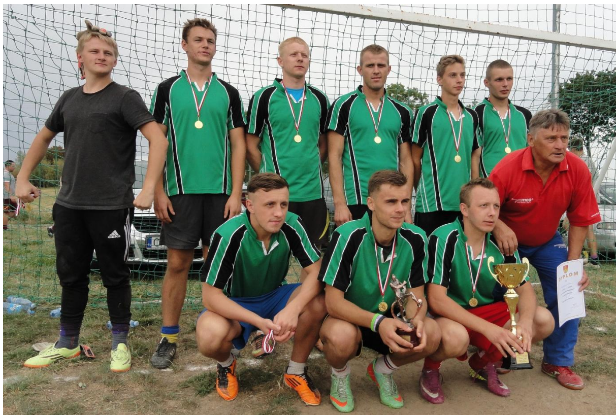
Zwycięzca turnieju - drużyna z Cetek.