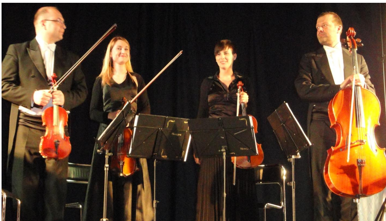
Kwartet smyczkowy „Prestige”.