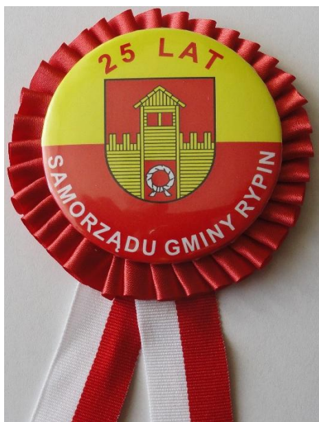
Pamiątkowy znaczek oraz statuetka.