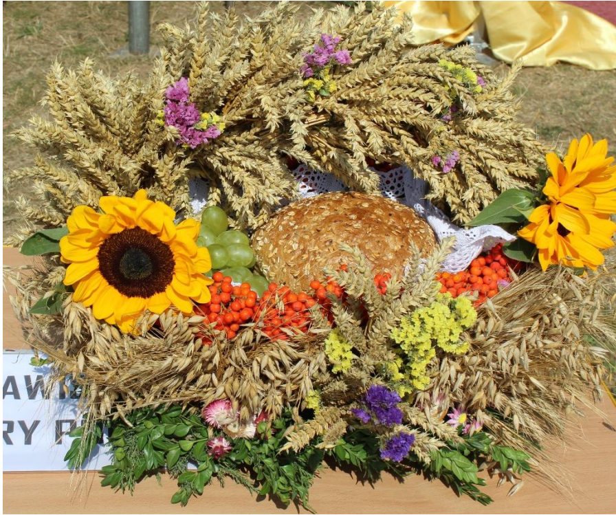
Wieniec z sołectwa Stawiska.