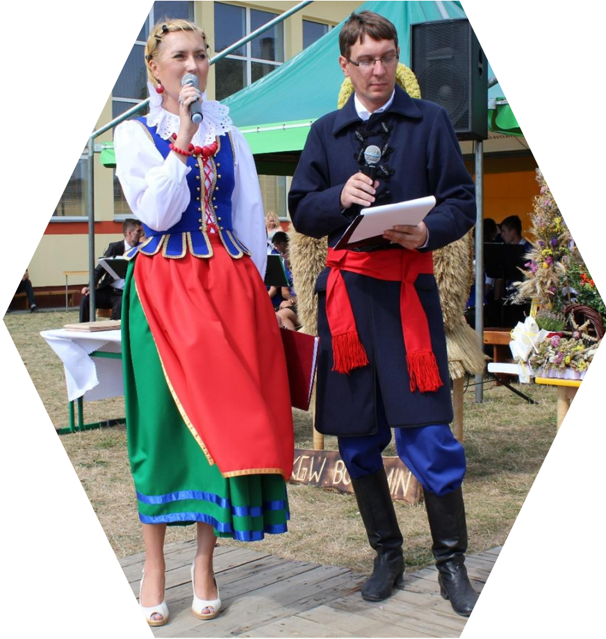
Prowadzący dożynki w strojach dobrzyńskich.