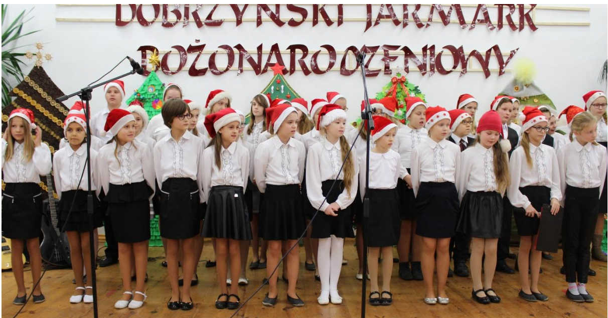
Zespół wokalny Szkoły Podstawowej w Borzyminie.