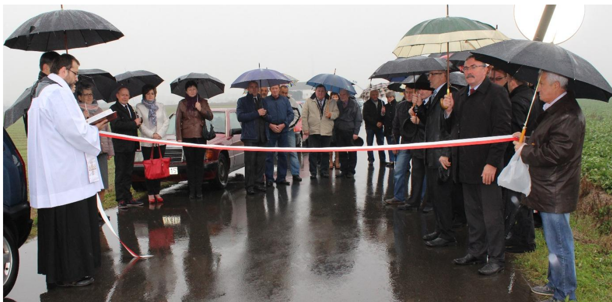
Poświęcenie i otwarcie drogi Cetki – Czyżewo.