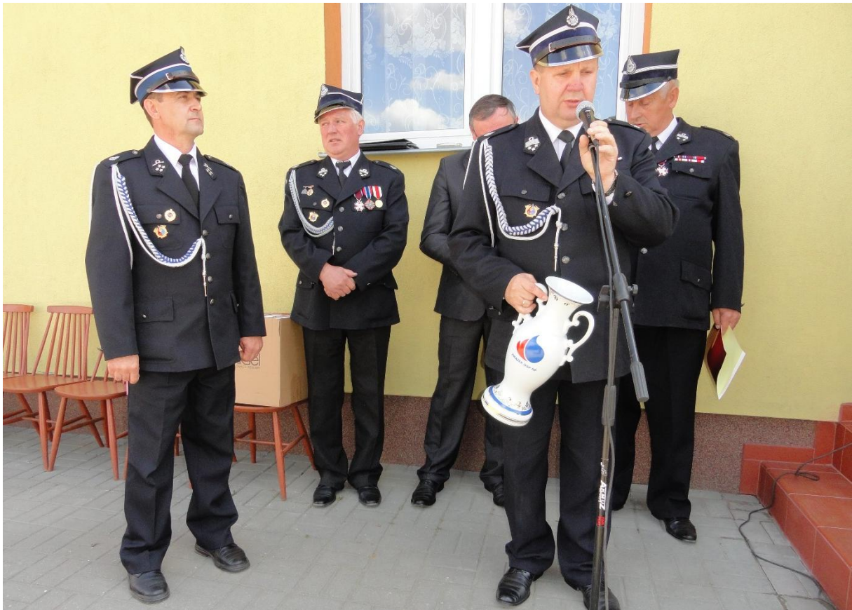
Przemawia poseł Zbigniew Sosnowski.