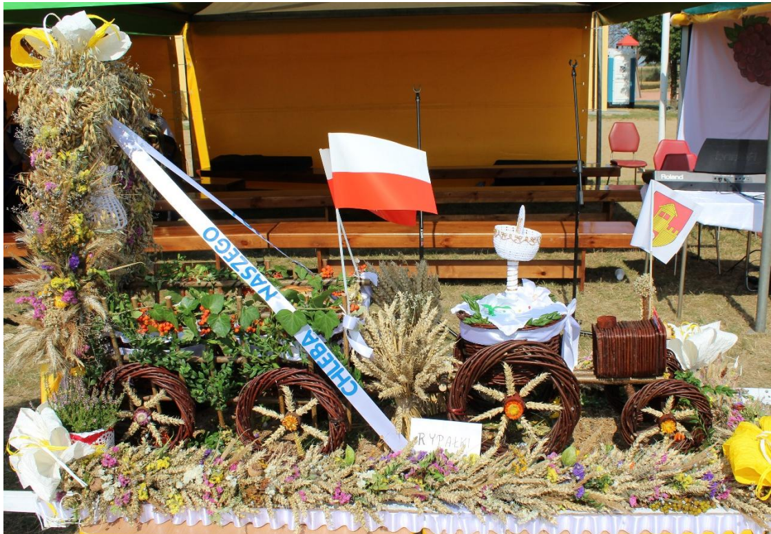
Wieniec KGW Rypałki Prywatne.