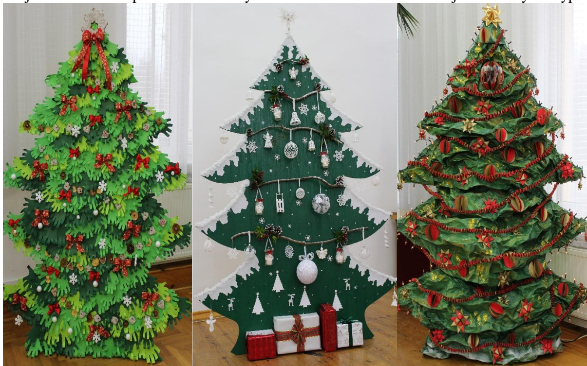
Najwyżej ocenione choinki: SP Stępowo, KGW Rusinowo, SP Borzymin.