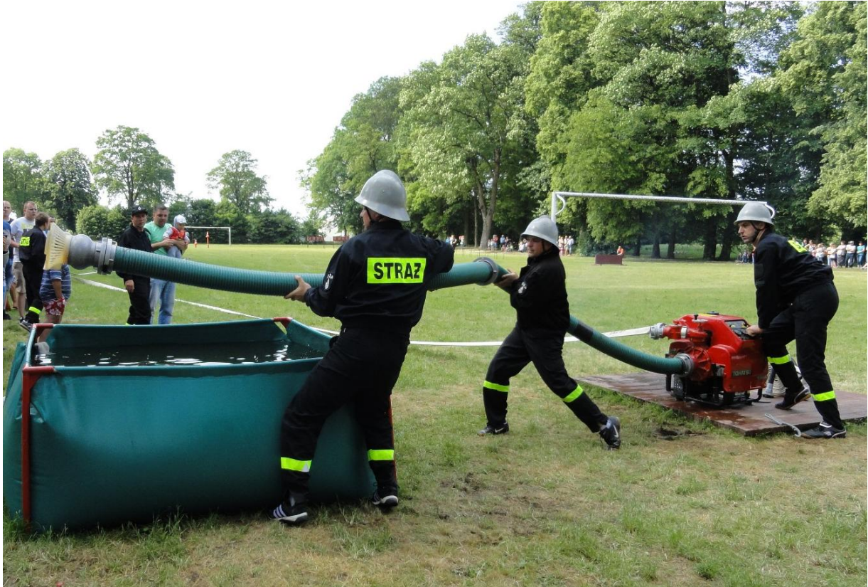
Rywalizacja była niezwykle zacięta.