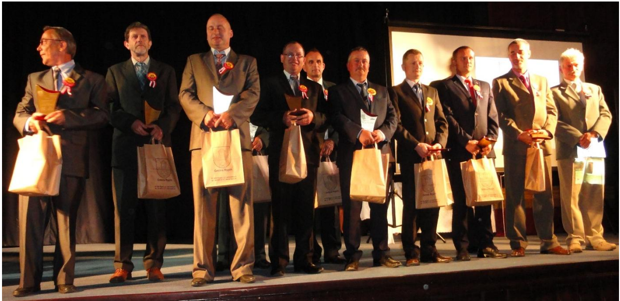
Załoga Bazy Magazynowo-Warsztatowej w Głowińsku – pracownicy pomocniczy i obsługi Urzędu Gminy Rypin.