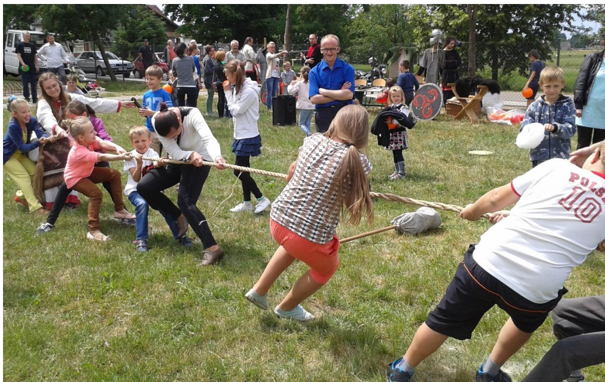
... oraz w Stępowie.