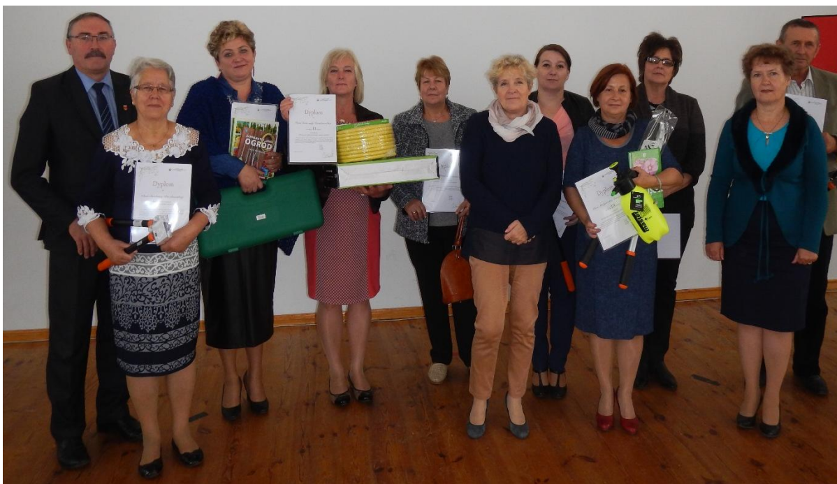
Nagrodzeni w konkursie.