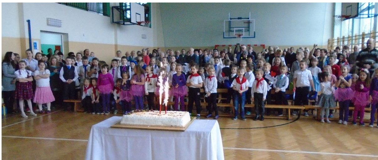
Dzień Babci i Dziadka w Szkole Podstawowej w Sadłowie.