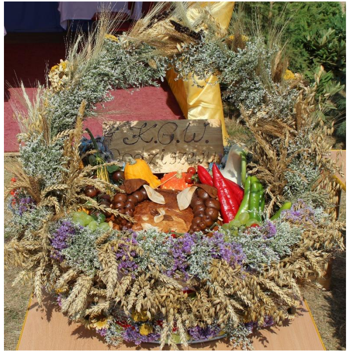
Wieniec KGW Godziszewy.