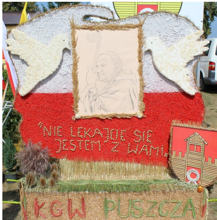
Wieniec KGW Puszcza Rządowa.