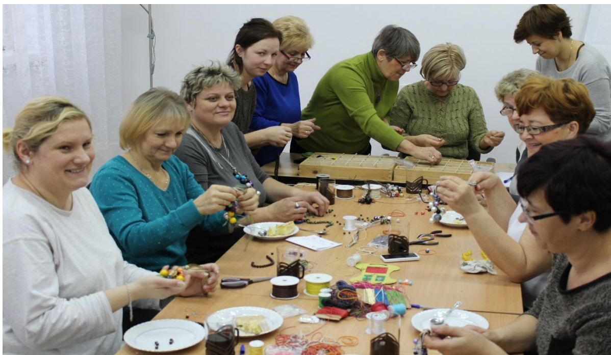
„Wyrób biżuterii i ozdób”. Poniżej: „Ozdoby ze słomy”.