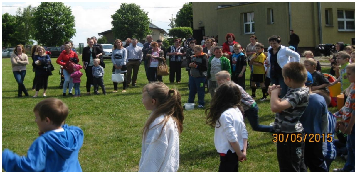
Na boisku szkolnym w Sadłowie ...

W maju i czerwcu w Szkołach Podstawowych w Sadłowie, Starorypinie Rządowym, Stępowie i Zakroczu odbyły się festyny i pikniki rodzinne. Zaprezentowano przedstawienia sceniczne, występy artystyczne, pokazy rycerskie i strażackie, rodzinne zmagania sprawnościowe itp.