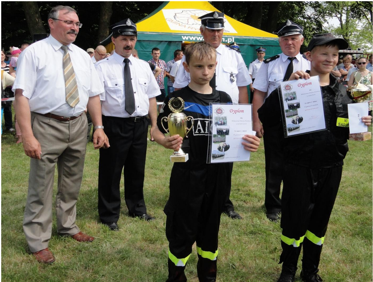
Nagrodzeni przedstawiciele młodzieży oraz dorosłych.