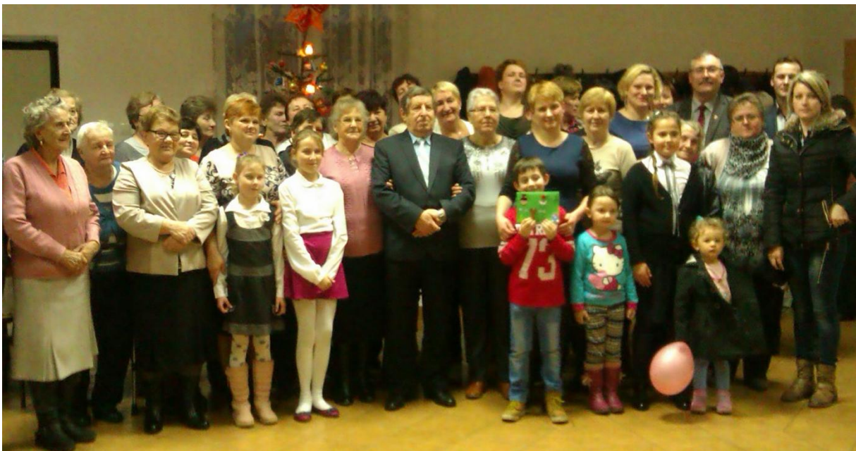
Uczestnicy uroczystości w Rypalkach.