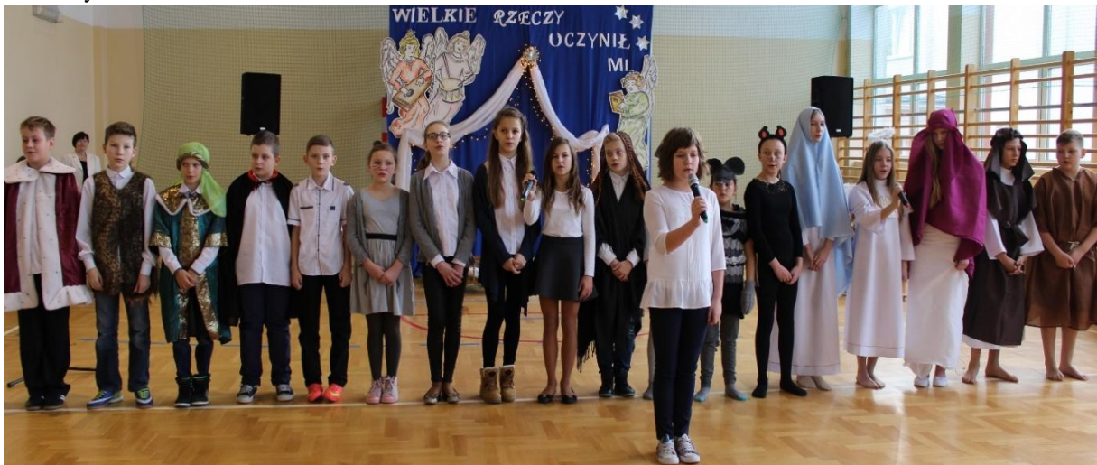
SP Starorypin Rządowy. Poniżej: SP Sadłowo