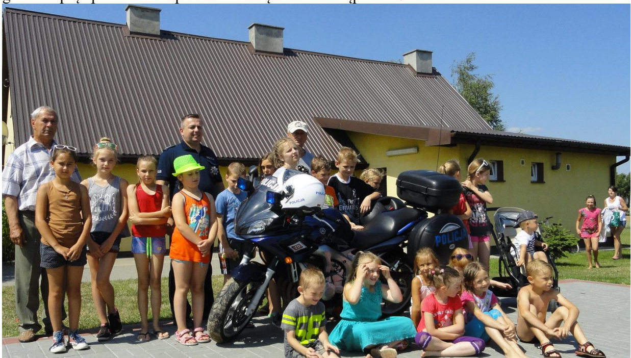
Dzieci po spotkaniu z funkcjonariuszem Policji w Mariankach.