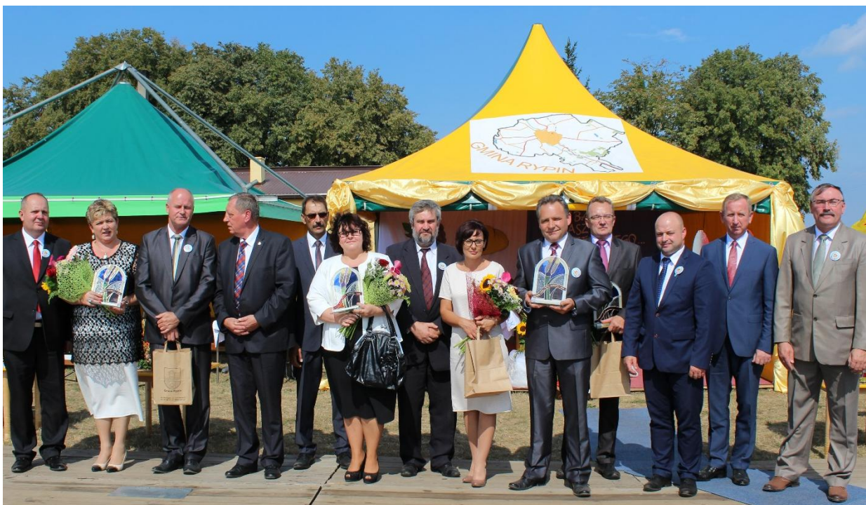
Nagrodzeni rolnicy z gośćmi dożynek.