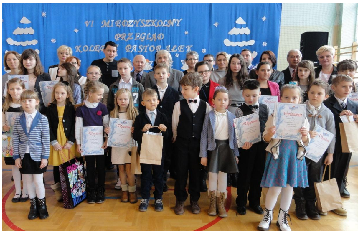
Uczestnicy i ich opiekunowie oraz goście przeglądu.