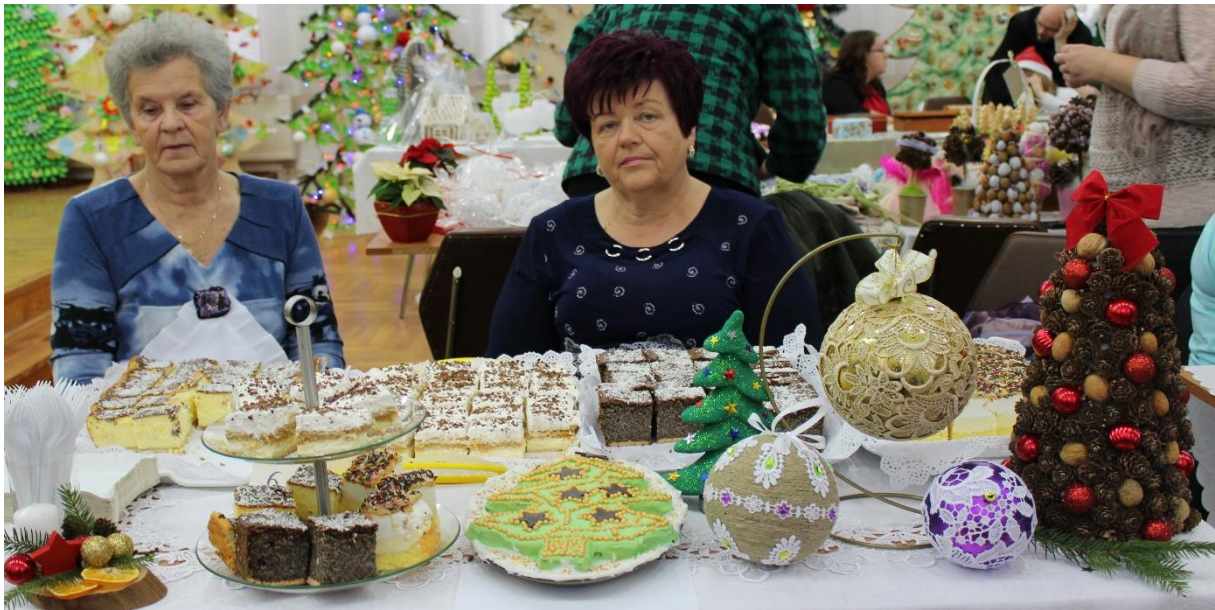
Stoisko KGW Rusinowo. Poniżej: widok ogólny Sali.