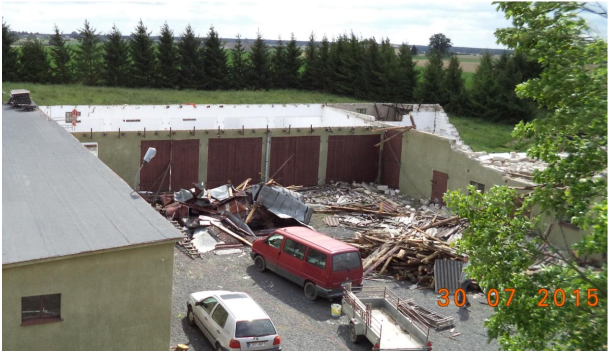
Zniszczona posesja w Godziszewach.