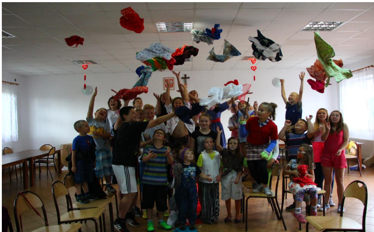
Zabawy dzieci w Rypalkach.