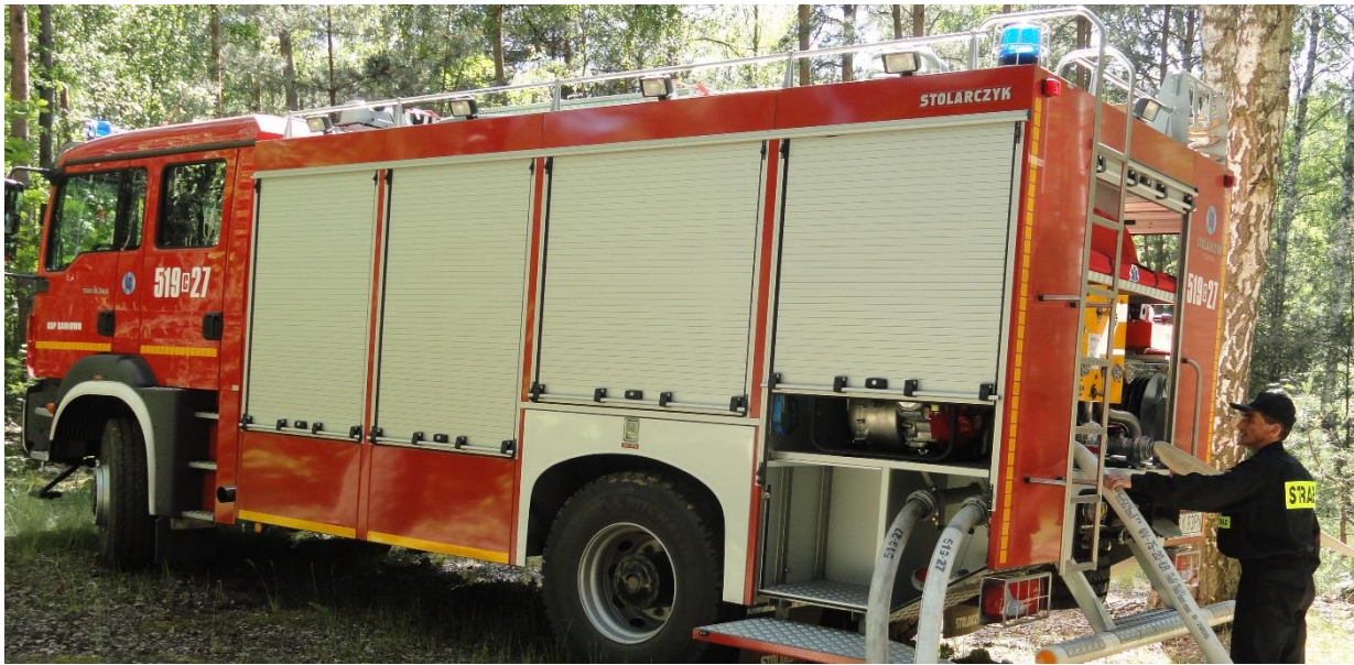
Kierowca OSP Sadłowo Zbigniew Zdrojewski podczas ćwiczeń.