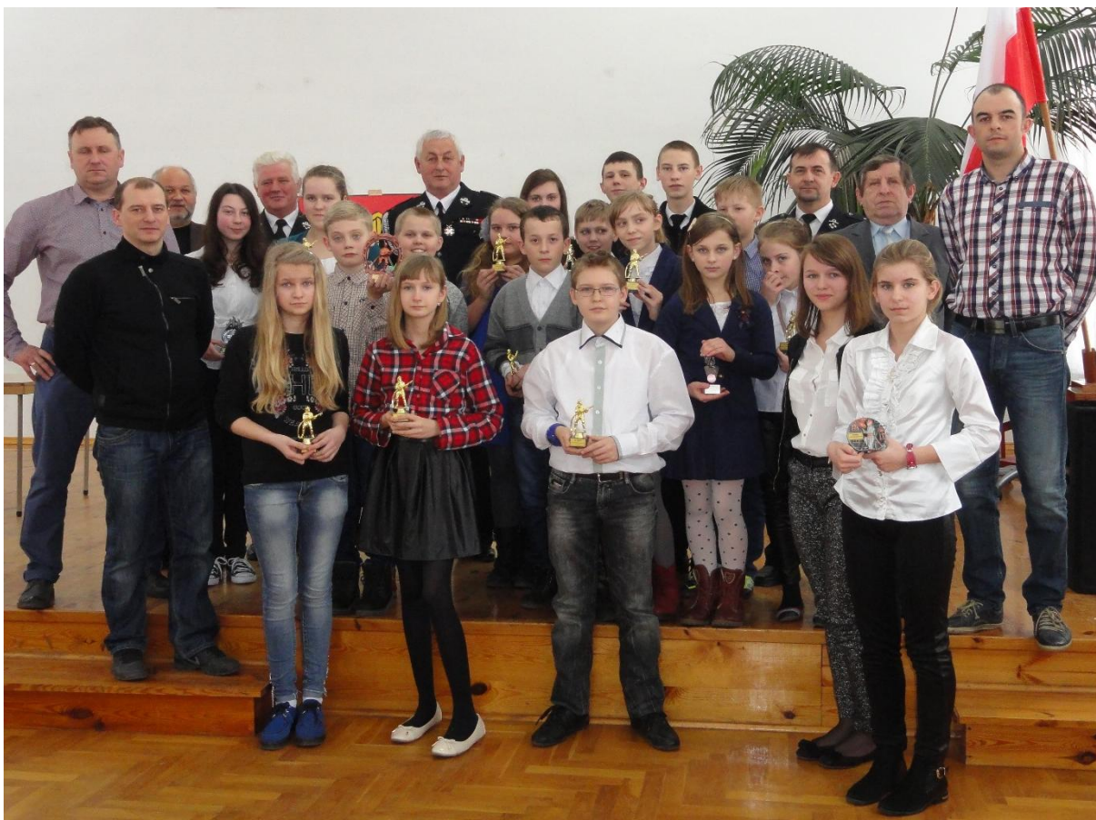
Uczestnicy eliminacji z opiekunami i organizatorami.