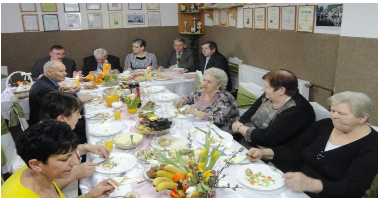
Spotkanie w Mariankach.

W okresie od 12 do 28 marca 2015 roku we wsiach gminy Rypin odbyły się tradycyjne spotkania poprzedzające Święta Wielkanocne. Spotkania odbyły się w 12. kołach gospodyń wiejskich i były formą integracji środowisk wiejskich. Były też okazją do zaprezentowania dekoracji stołów oraz potraw świątecznych.