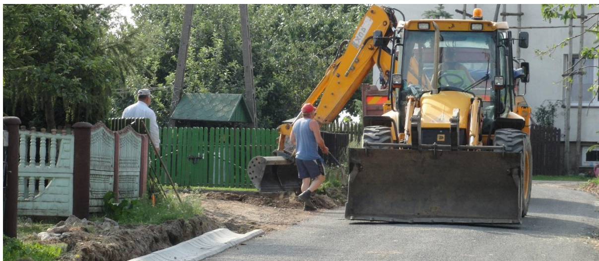
Budowa drogi w Staroropinie Prywatnym (Plabanka). Poniżej: otwarcie i poświęcenie drogi Cetki-Czyżewo.