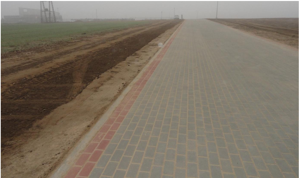
Droga w Starorypinie Prywatnym do cmentarza. Poniżej droga na Osiedlu Mieszkaniowym w Starorypinie P.