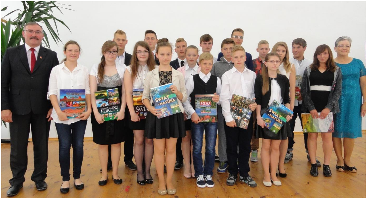
Nagrodzeni uczniowie w towarzystwie wójta gminy i przewodniczącej rady gminy.