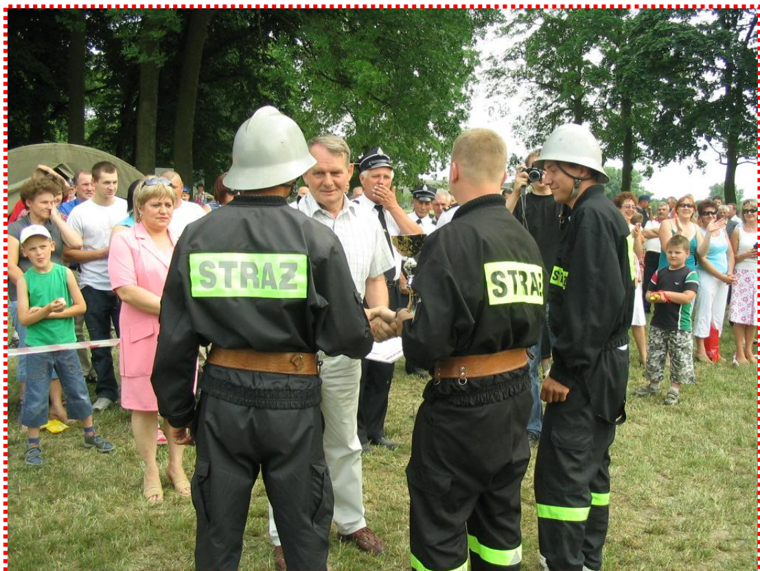
Drużyna OSP Sadłowo odbiera puchar za zwycięstwo z rąk wójta gminy Ryszarda Potwardowskiego