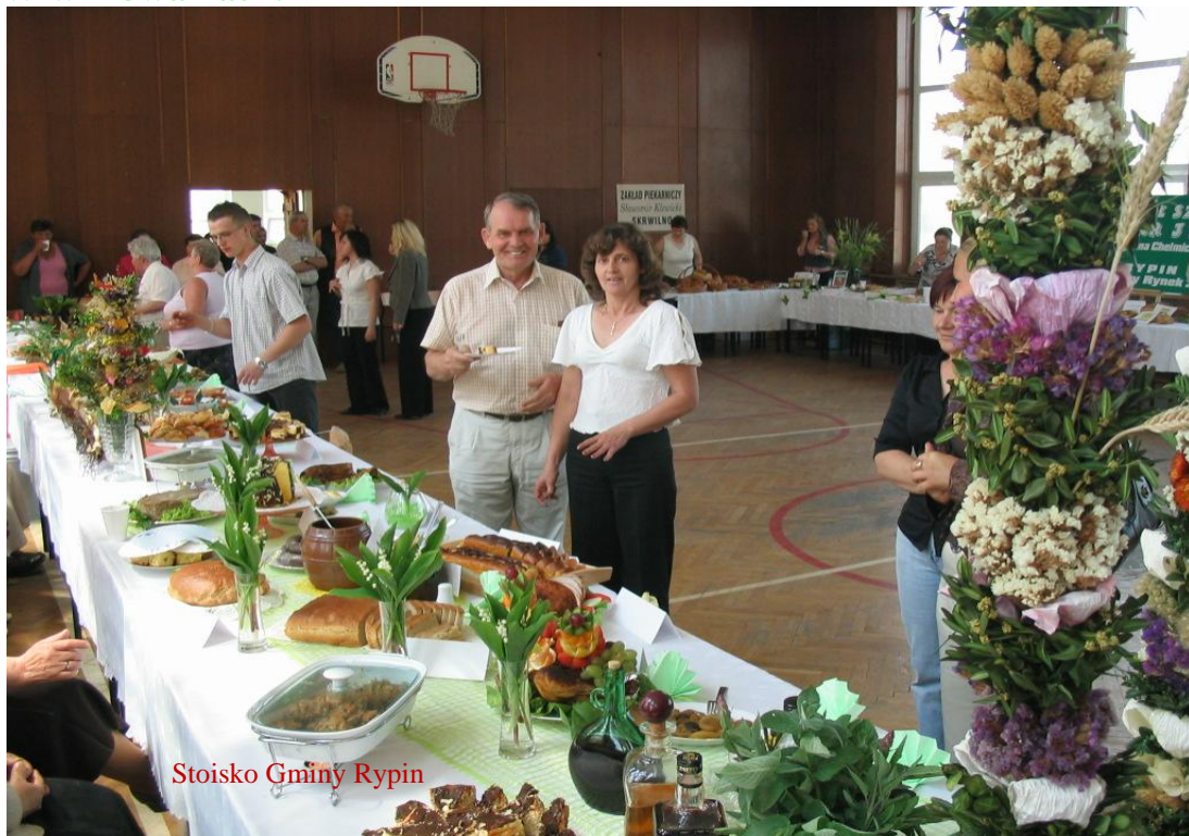
Stoisko Gminy Rypin

Komisja konkursowa najwyżej oceniła tort upieczony przez Panie z KGW w Kowalkach.