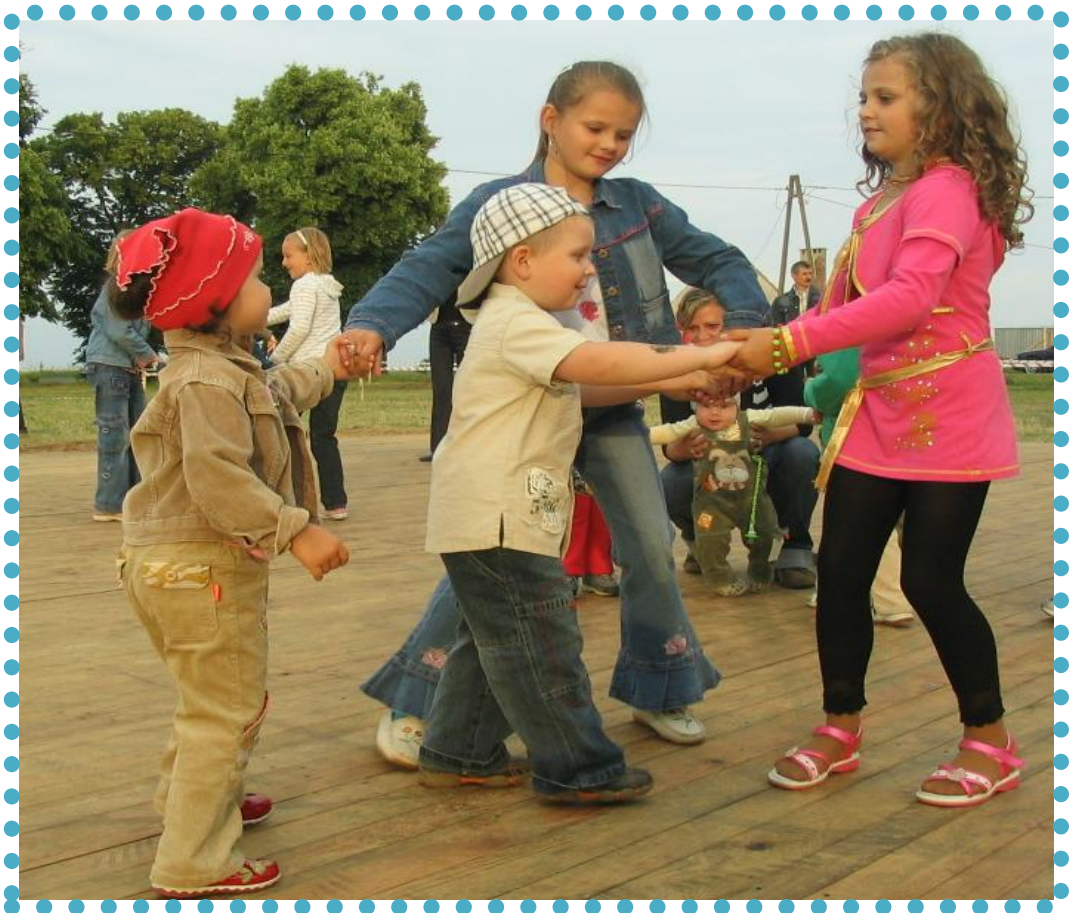
Festyn „U Jana” w Mariankach.