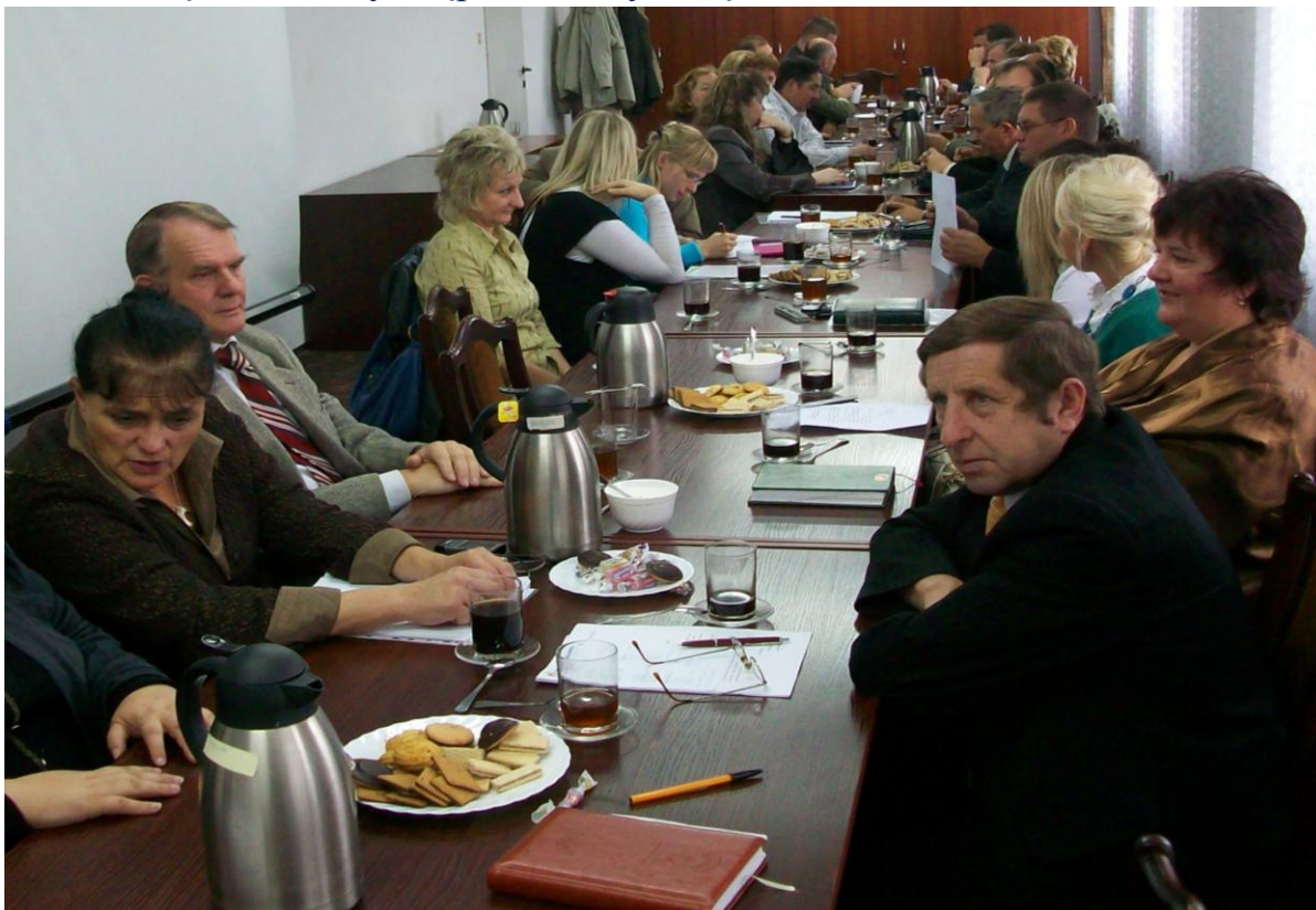
Przedstawiciele gminy podczas walnego zebrania