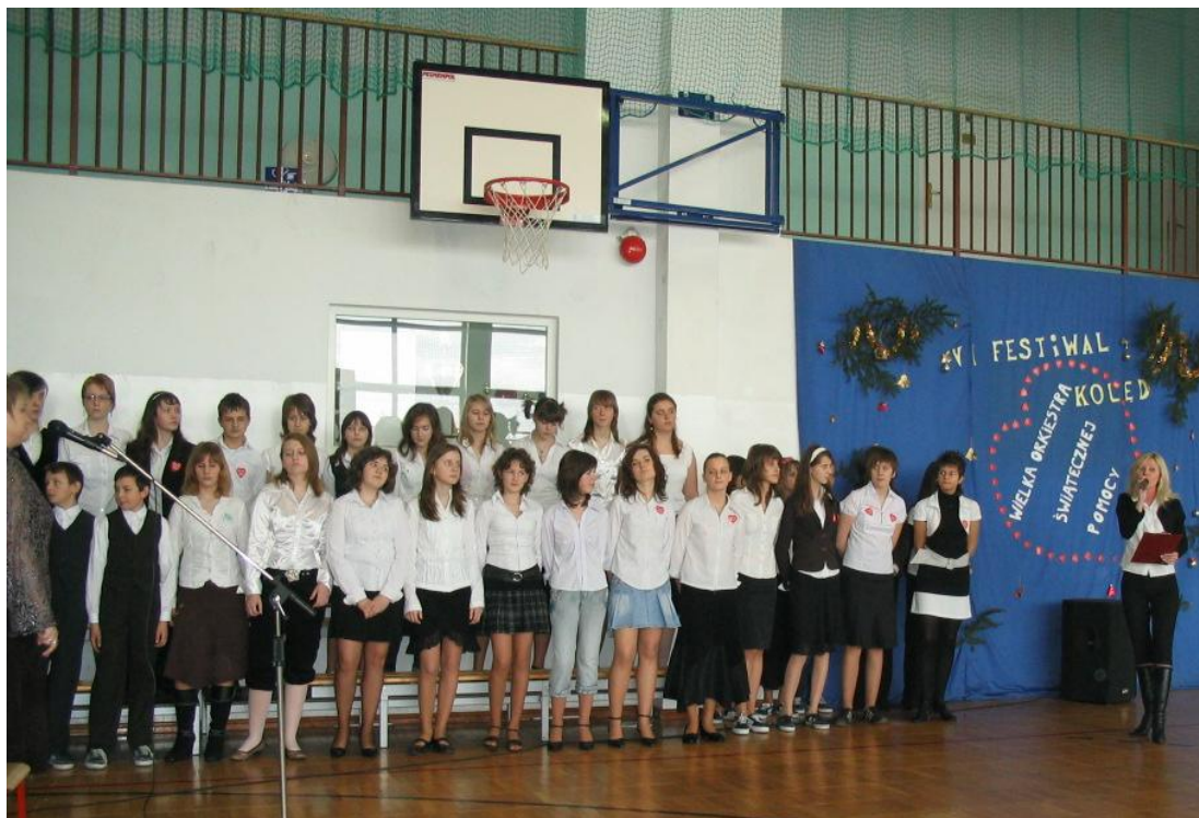
Chór podczas występu.