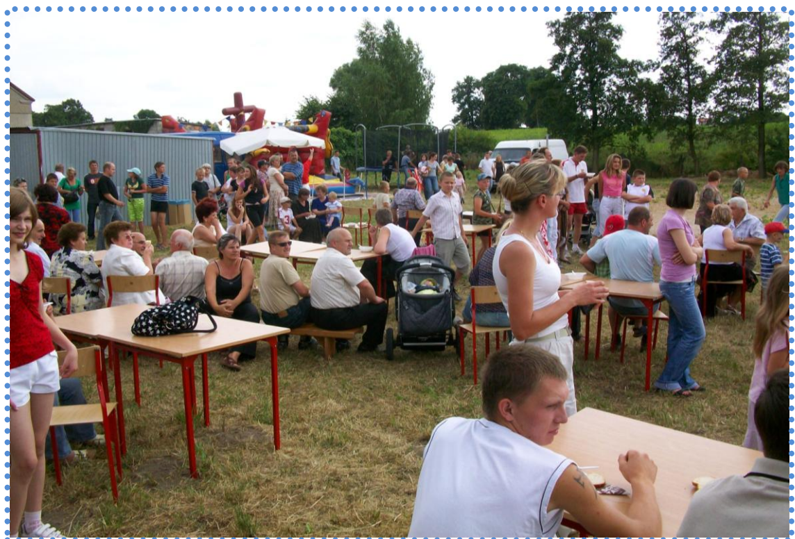
Uczestnicy festynu w Kowalkach.