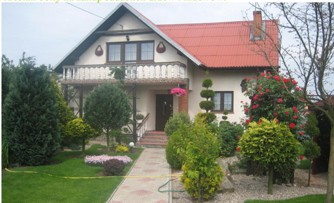
Nagrodzona posesja Danuty i Sylwestra Paradowskich.

Zwycięzcy otrzymali od Wójta Gminy nagrody pieniężne i dyplomy a pozostali bony na zakup sadzonek drzew i krzewów.