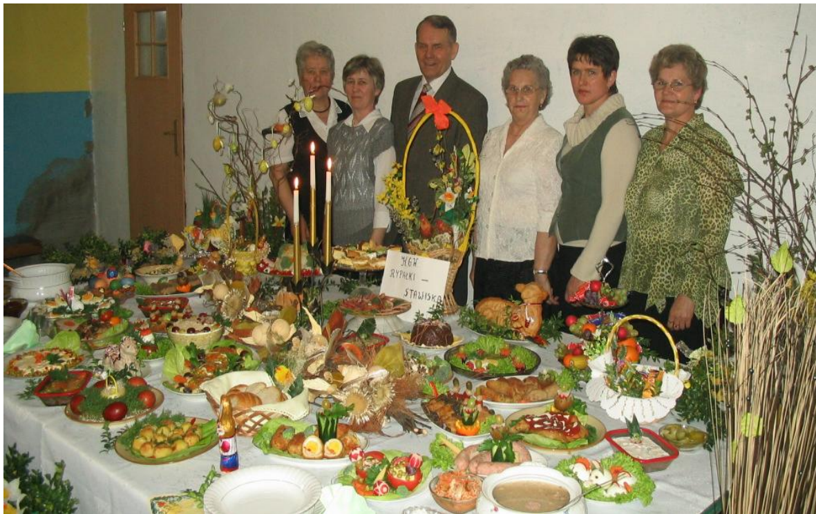
Stół wielkanocny przygotowany przez KGW Rypańki-Stawiska.