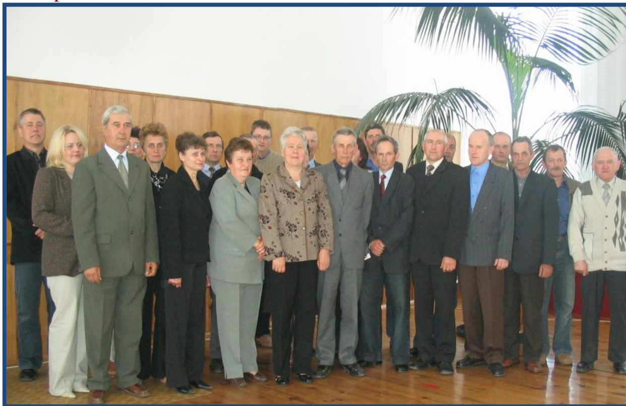
Sołtysi gminy Rypin.