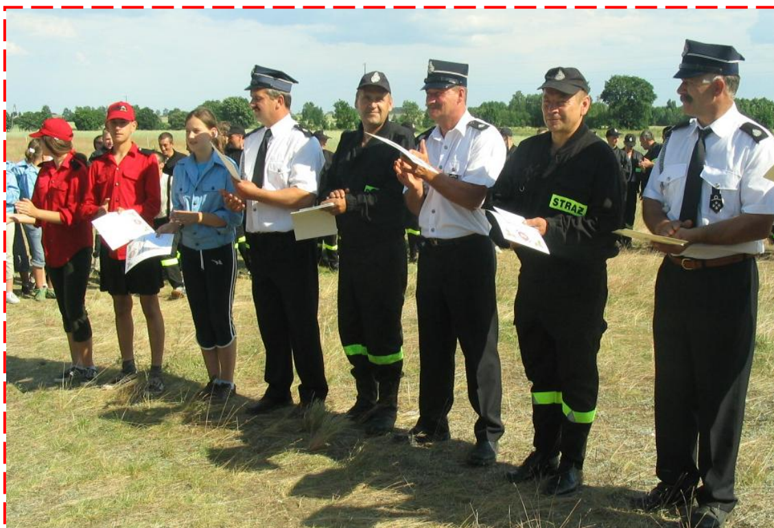
Kierownicy drużyn otrzymali dyplomy oraz nagrody finansowe od Wójta Gminy Rypin.