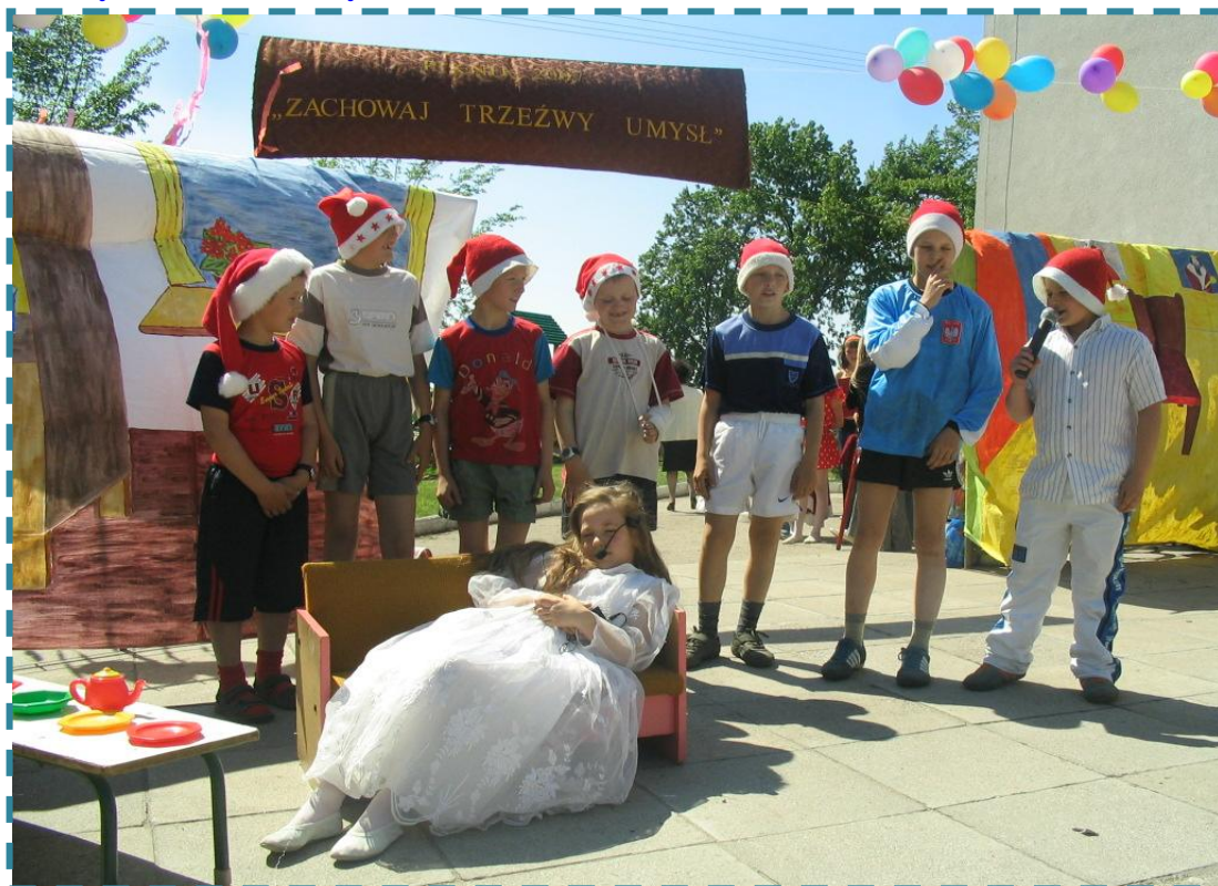
Piknik rodzinny „Zachowaj Trzeźwy Umysł” w Starorypinie – występ uczniów ze szkoły podstawowej.

Wzorem lat ubiegłych na terenie gminy odbyły się różnego rodzaju pikniki i zabawy organizowane przez samorządy wiejskie przy udziale finansowym gminy. Imprezy tego typu odbyły się w następujących miejscowościach: Starorypin /19.05/, Borzymin /19.05, 1.09/, Dębiany /9.06, 23.06, 28.07, 25.08/, Sadłowo /24.06 – festyn parafialny, 04.08/, Zakrocz /30.06/, Puszcza /7.07/, Czyżewo /8.07/, Rusinowo /14.07/, Kowalki /14.07, 4.08/, Głowińsk /21.07/, Cetki /18.08/, Balin /25.08/, Godziszewy /25.08/, Borzymin /1.09/.