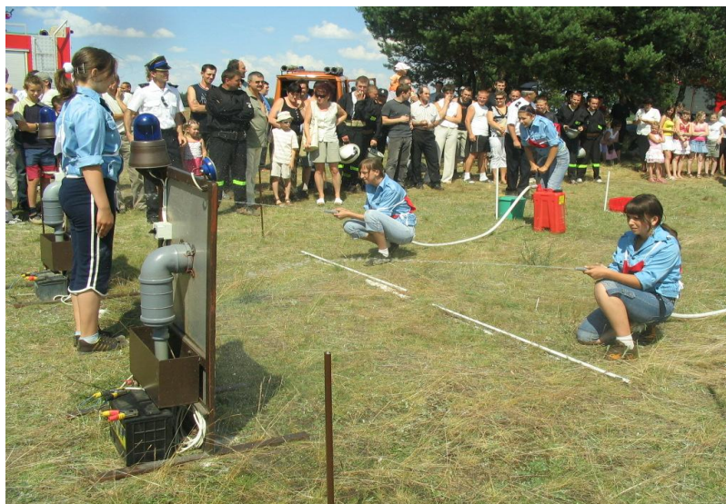
MDP z OSP Sadłowo podczas zawodów.