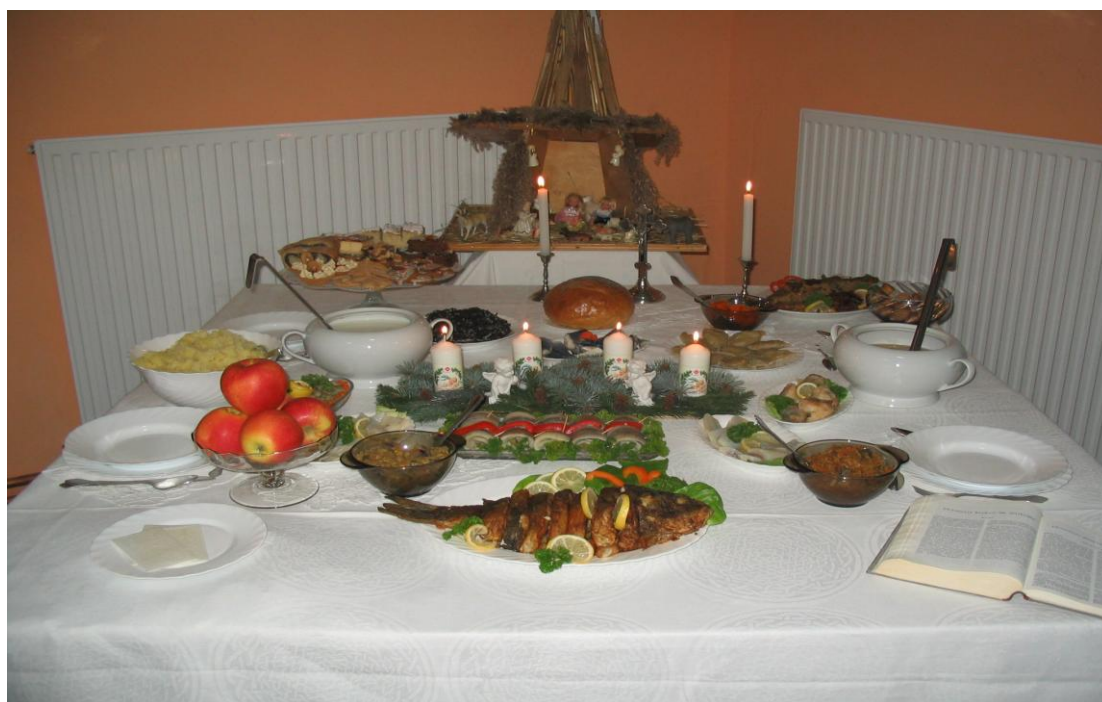
Stoły wigilijne KGW: Balin /górne/, Sadłowo /dolne/.

Pierwsze miejsce przyznano ex aequo KGW w Balinie i KGW w Sadłowie, drugie KGW w Kowalkach, trzecie KGW w Rypałkach-Stawiskach.