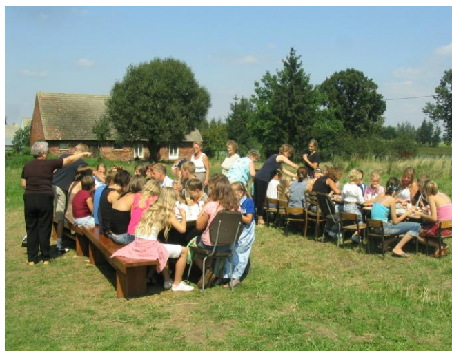
Letni wypoczynek zorganizowany przez KGW w Mariankach.