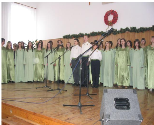
Chór Gimnazjum w Kowalkach.