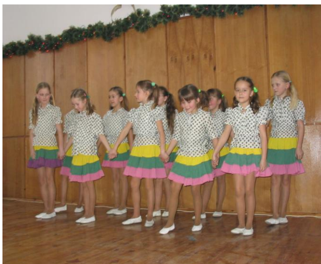
SP w Starorypinie.

W dniu 17 stycznia w sali konferencyjnej urzędu gminy odbył się Koncert Noworoczny. W wypełnionej po brzegi sali radni, sołtysi, nauczyciele, pracownicy samorządowi, członkinie KGW, strażacy i wielu mieszkańców gminy wysłuchało i obejrzało inscenizacje kolęd przygotowane przez uczniów szkół podstawowych i gimnazjum.