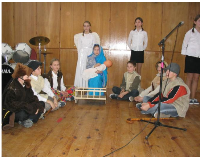
SP w Stępowie.