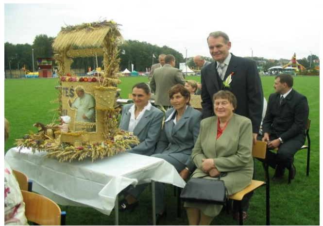
KGW Sadłowo Nowe