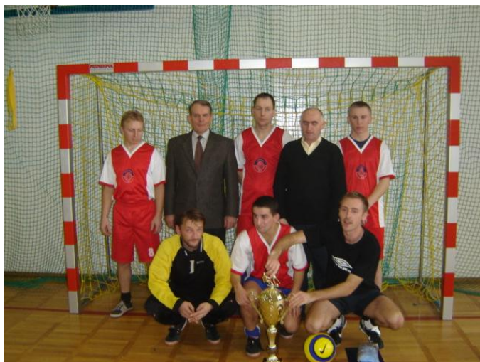
Zwycięska drużyna z Zakrocza.

Noworoczny turniej piłki nożnej sołectw o puchar wójta gminy odbył się w dniu 14 stycznia w Gimnazjum w Kowalkach. Startowało 8 drużyn. Najlepszą okazała się drużyna z Zakrocza przed Cetkami i Sadłowem.