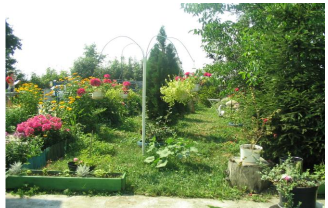
Oto niektóre ogrody