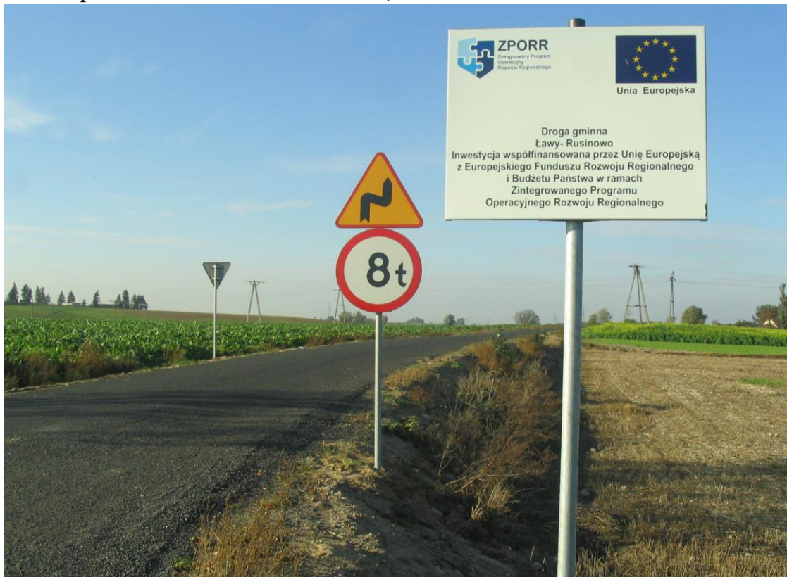
Początek drogi Ławy – Rusinowo.

Inwestycje były możliwe dzięki pozyskaniu przez gminę dotacji z Unii Europejskiej oraz budżetu państwa w kwocie 1.593.073,94 zł.