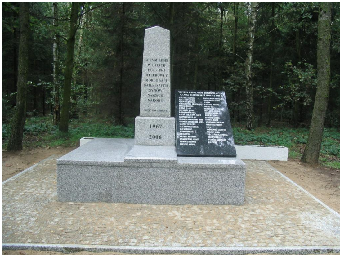
Widok ogólny nowego pomnika.