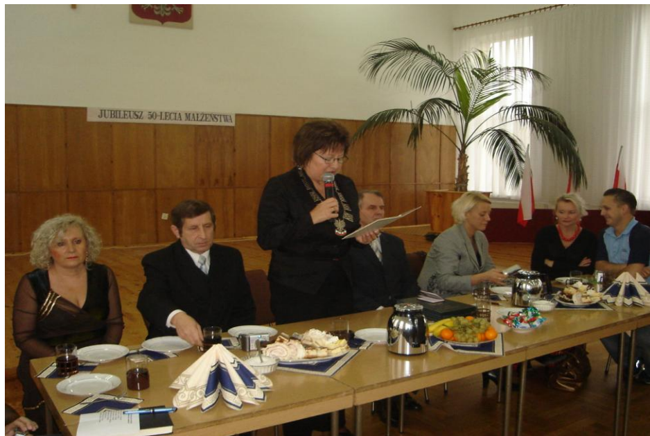
Migawki z uroczystości.