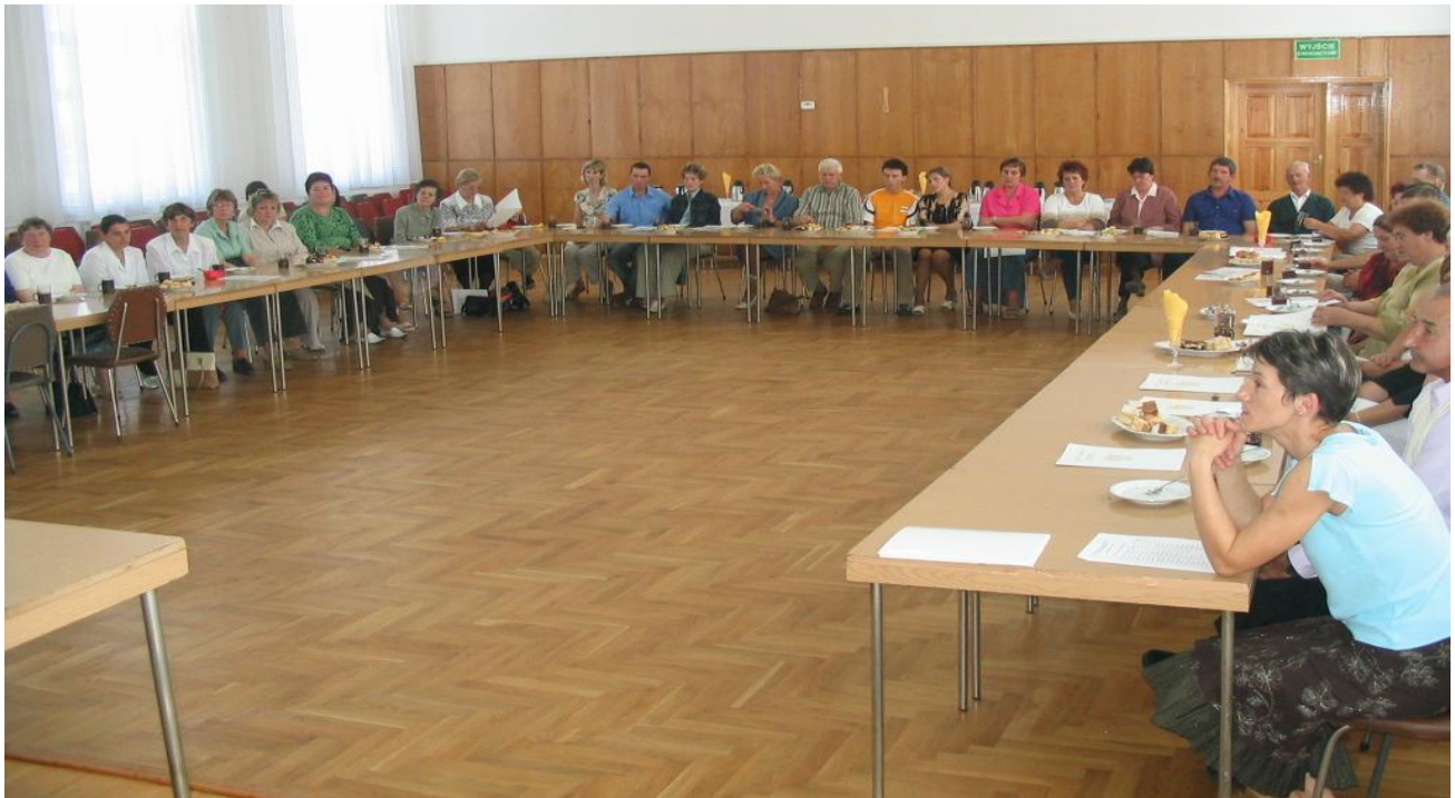
Uczestnicy konkursu podczas jego podsumowania w Sali konferencyjnej Urzędu Gminy Rypin