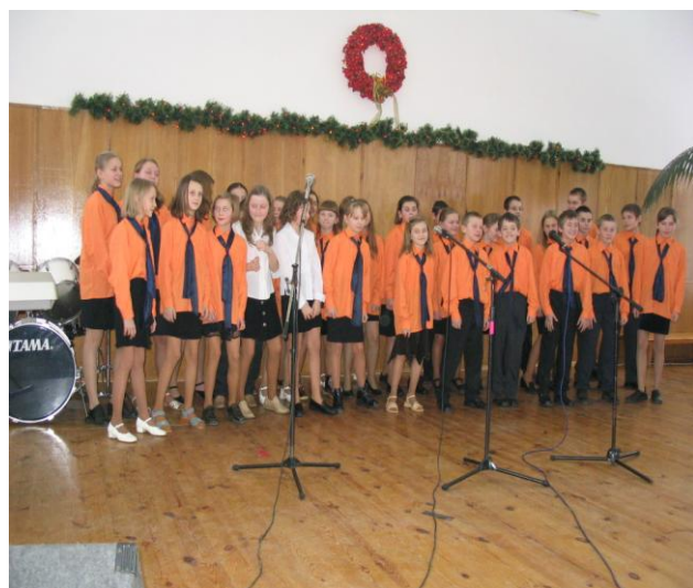
SP w Borzyminie.