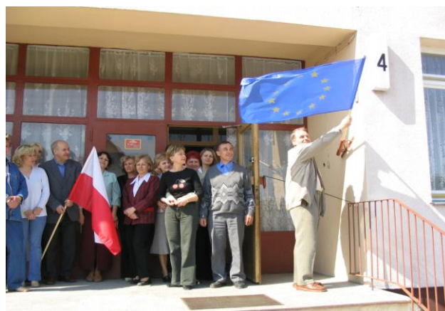
Załoga urzędu podczas zatknięcia flagi UE na budynku przez Wójta Gminy Ryszarda Potwardowskiego.