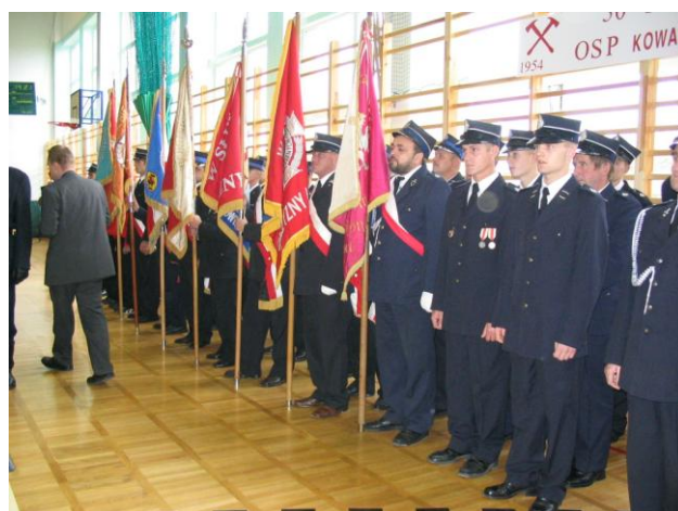
Migawki z uroczystości wręczenia sztandaru.