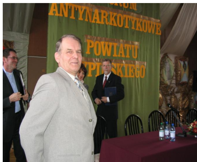
Jolanta Kwaśniewska i Ryszard Potwardowski obecni na Forum.