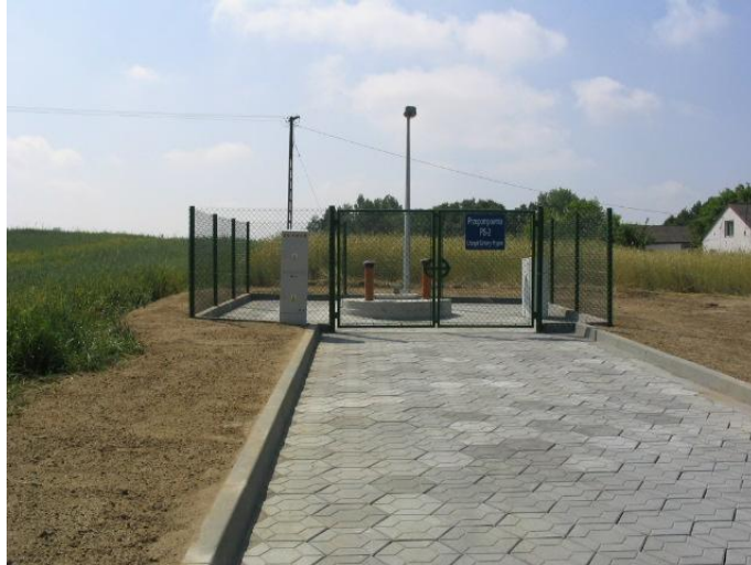
Przepompownia ścieków w Starorypinie

W ramach robót publicznych i prac interwencyjnych zatrudniono w ciągu całego roku 57 bezrobotnych na okres od 3 do 6 miesięcy.