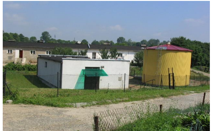
Stacja ujęcia wody w Starorypinie

W zakresie budowy dróg zrealizowano utwardzenie ich na odcinkach: