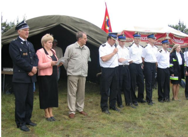
Organizatorzy i sędziowie zawodów.

Tradycją od szeregu stało się organizowanie zawodów sportowo-pożarniczych dla członków ochotniczych straży pożarnych. W 2005 roku zawody odbyły się w Stępowie w dniu 4 czerwca.