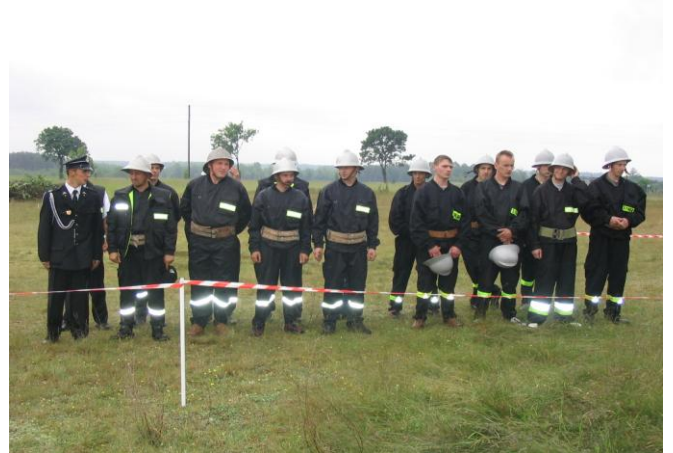
Odprawa przed zawodami.

W dniach 10-11 września na obiektach MOSiR w Rypinie odbyło się doroczne święto plonów – AGRA RYPIN. Wieńce dożynkowe wykonały członkinie Kół Gospodyń Wiejskich w Sadłowie i Rypałkach.