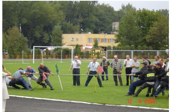
Rywalizacja gmin – przeciąganie liny.

W dniu 5 lipca przed budynkiem Urzędu Gminy Rypin odbyło się uroczyste poświęcenie samochodu Opel Astra II i przekazanie Komendzie Powiatowej Policji w Rypinie dofinansowanego w części przez samorząd gminy.