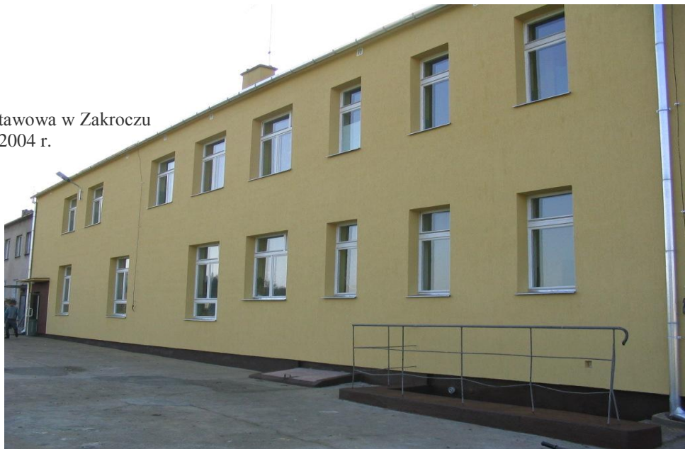
Szkoła Podstawowa w Zakroczu Zdjęcie z X 2004 r.