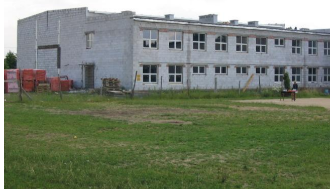
Budowa gimnazjum – zdjęcie z VI 2003 r.

Wybudowano drogę utwardzoną Dylewo – Sikory o długości 2,102 km. Kosztem 905.639 zł wybudowano salę gimnastyczną o wymiarach 12x24m a także kotłownię na olej opałowy przy Szkole Podstawowej w Borzyminie oraz rozpoczęto rozbudowę budynku Gimnazjum w Kowalkach.