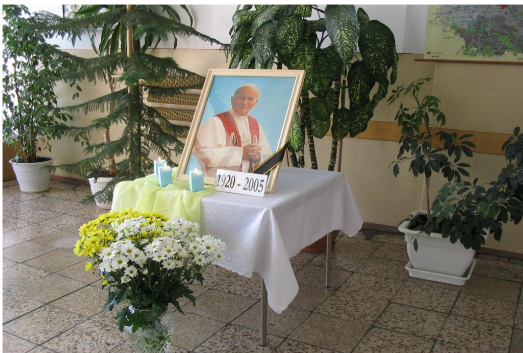
Hall urzędu w okresie żałoby.

Kolejny tragiczny dzień – tym razem dla całej Polski. Dnia 02 kwietnia o godz. 21.37 kończy życie Wielki Polak – Papież Jan Paweł II - HONOROWY OBYWATEL GMINY RYPIN.